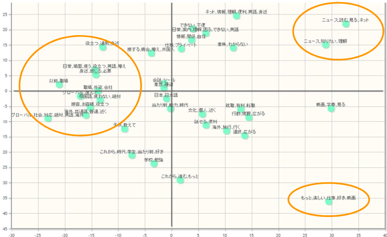
図3 パースペクティブ